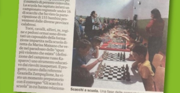
Gazzetta del Sud, giugno 2018

Forse il progetto recente di Arthur Schopenhauer per gli scacchi non è mai stato così attuale come lo è oggi. Gli scacchi sono un gioco di strategia e di logica, ma anche di vita. Insegnare scacchi ai bambini è un modo per insegnare loro a pensare e a risolvere i problemi.