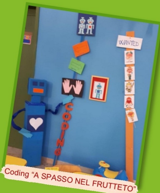
Coding "A SPASSO NEL FRUTTETO"