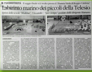
Gazzetta del Sud, giugno 2018