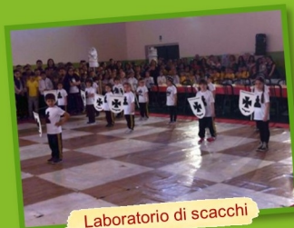
Laboratorio di scacchi

Visita virtualmente la nostra scuola TI ASPETTIAMO!