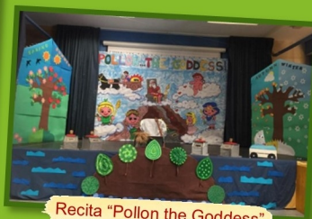
Recita "Pollon the Goddess"